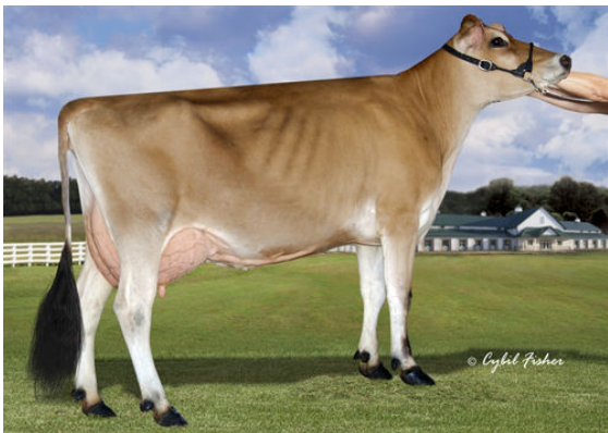
JER-Z-BOYZ MACNCHEZ 48947 GRANDDAM