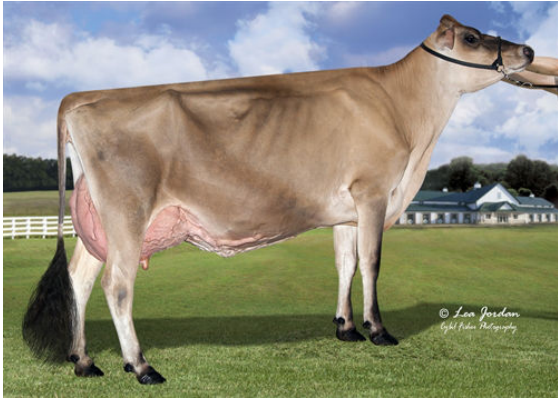
RIVER VALLEY LSTWL MACNCHEZ 5055 DAM

JX RIVER VALLEY CHIEF {6} RIVER VALLEY LSTWL MACNCHEZ 5055 EX-91%-3YR-USA HILLVIEW LISTOWEL-P JER-Z-BOYZ MACNCHEZ 48947 VG-87%-3YR-USA MISSISKA MACKENZIE JER-Z-BOYZ ZUMA 42059 EX-91%-3YR-USA